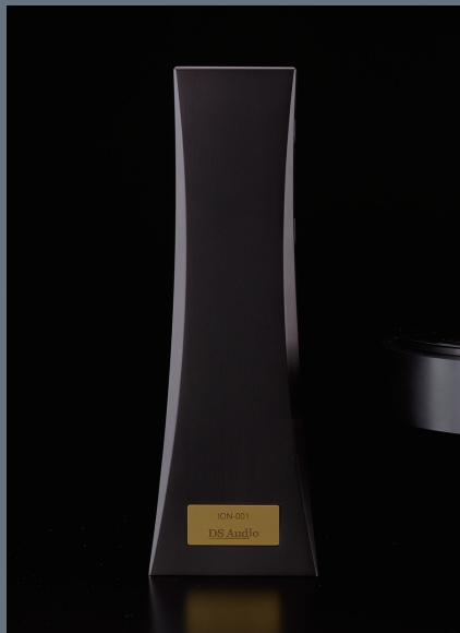
Vinyl イオナイザー ION-001